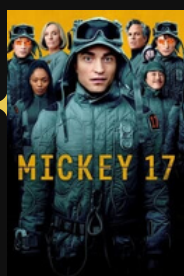
DVD du mois "Mickey 17"