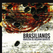
Vinyle du mois "Hamilton De Holanda"